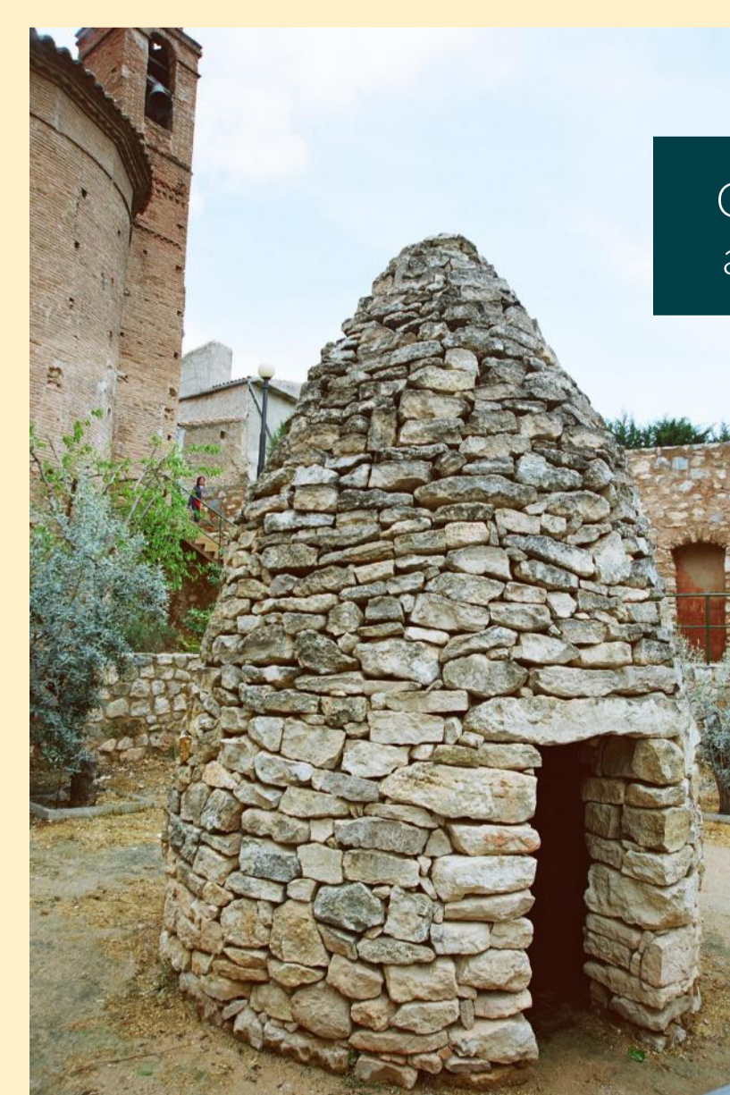
Casilla situada junto a la iglesia de Grisel.